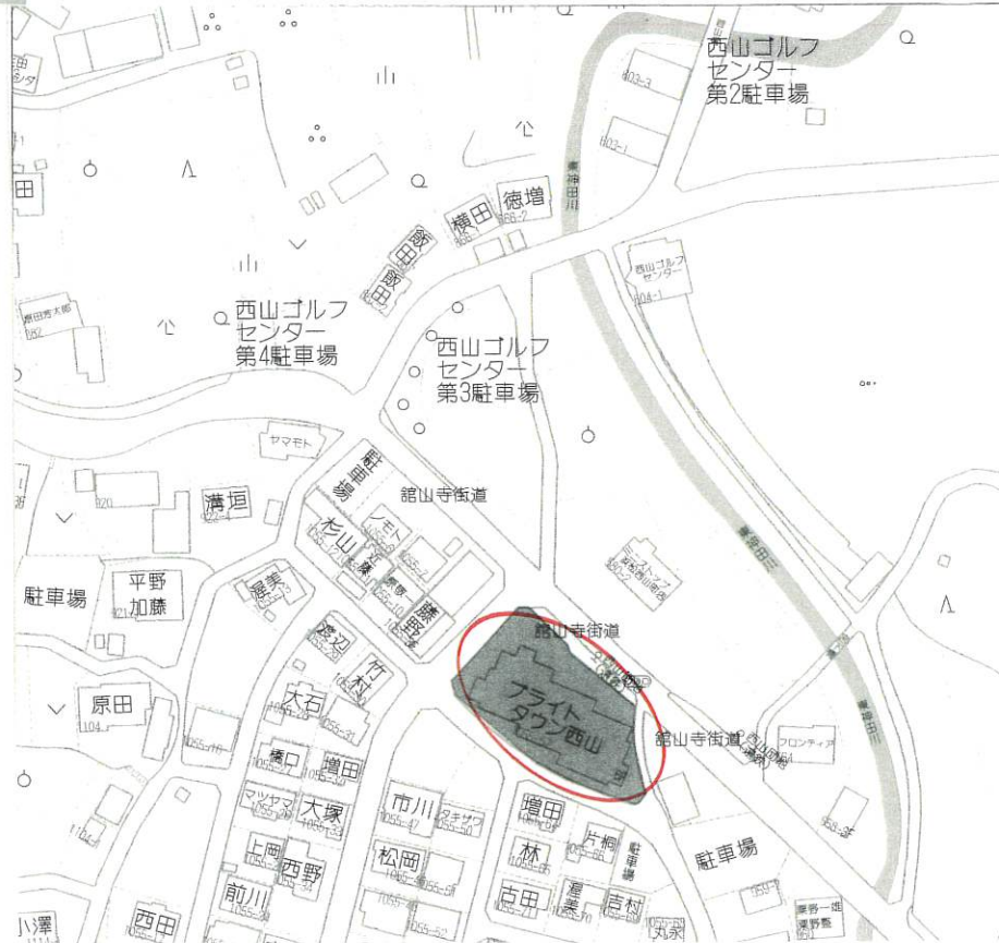
不動産会社間専用図面